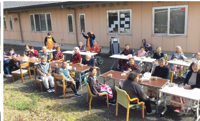
念願のお花見開催出来ました☆