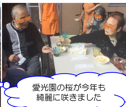
愛光園の桜が今年も綺麗に咲きました

『桜の名所 愛光園』今年も満開の桜が愛光園を包み込みました！例年より早い桜の開花でしたが、満開の時期には天気も良く、久しぶりに外でのお花見を行いました♪ 花吹雪の下、甘酒を飲みながらのお花見は最高でしたね☆ これからもコロナ禍で出来なかった楽しみを少しずつ行っていけるといいですね！ (愛光園デイ 内田)